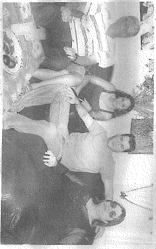
טחנו עם התעסוקה 'לאי שחלבו ויו התלשושיות מחזורי הוד"

"עם גובים" הספר היו שומעו כמה עו קצו וטולו, הפכו אחרי לעבריו מין סודתי, חבריה מהכיתה שאתמול היו החברים הכי טובים שלי הפכו לי שורף. ואני אותו לעצמי 'עמו אני? לא היה לי שקט נשום תקום"